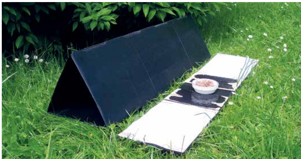
Igeltunnel (die Teile sind 91,5 cm lang und 26 cm breit), mit daneben liegender Tunnelplatte (24 cm breit). Die Platte wird in den Tunnel hineingeschoben.

Ein Tipp aus England: Holzkohle (Grillkohle) zerkleinert man mit einem Hammer