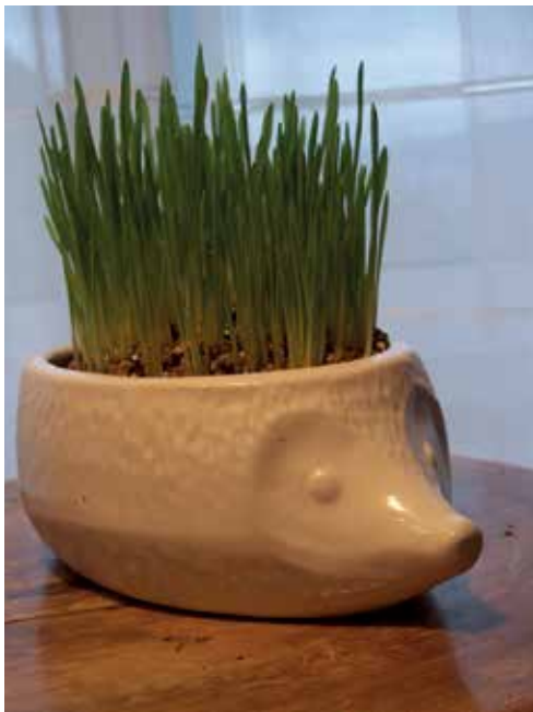
Jung, fesch, frisch emporgeschossen