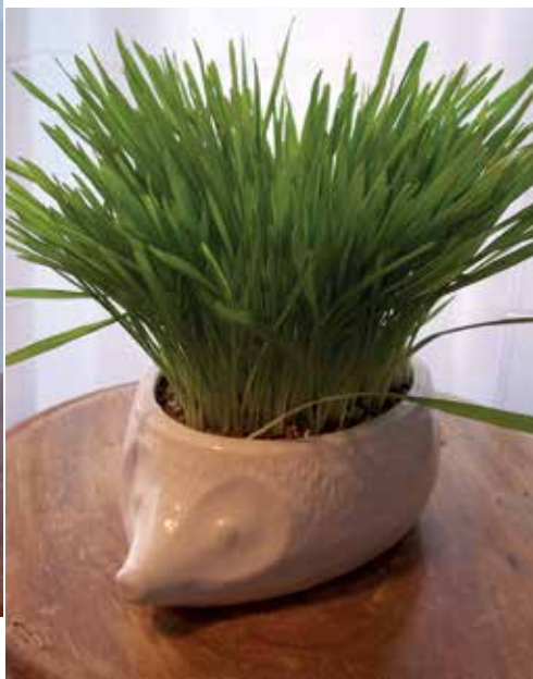
Die Stacheln werden zu lang!