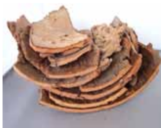
Abb. 6: Ein Rindenstapel. Man muss ein bisschen herumprobieren, bis die Rindenstücke möglichst eng aufeinander liegen.

lunder, Malven. Aber auch Maisstängel, Haselnussruten, Äste aller Art und Dicke kann man für ein Insektenhotel brauchen (Abb. 3).