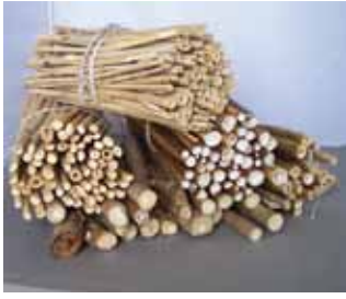
Abb. 3: Gebündelte Abschnitte von allerlei trockenen Stängeln.